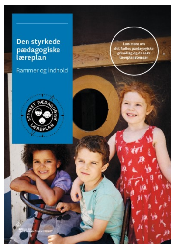
Den styrkede pædagogiske læreplan, Rammer og indhold

Denne skabelon indeholder alle de lovmæssige krav til evalueringen. Lovkravene finder I i de to midterste afsnit "Evaluering og dokumentation" og "Inddragelse af forældrebestyrelsen". Skabelonen indeholder desuden spørgsmål, som kan støtte jeres evalueringsproces samt jeres fremadrettede arbejde med løbende at revidere den skriftlige læreplan.